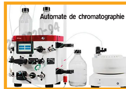
Automate de chromatographie