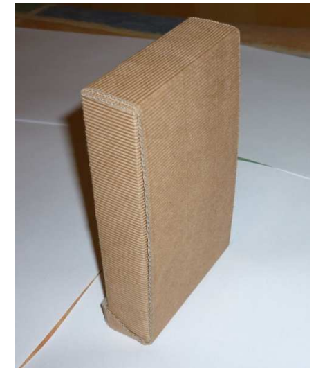
Mise en volume